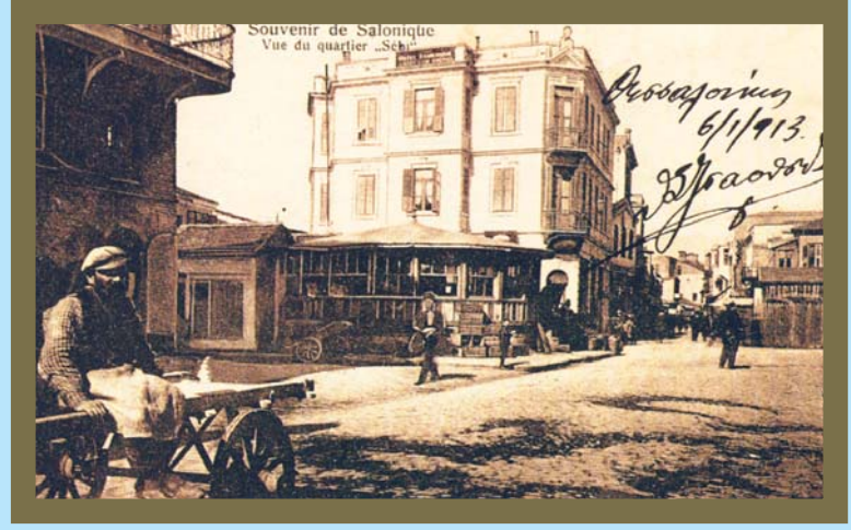
Bu resim çekme 1913 yılında ziyafete katıldığınız bu yerden oldu!!!